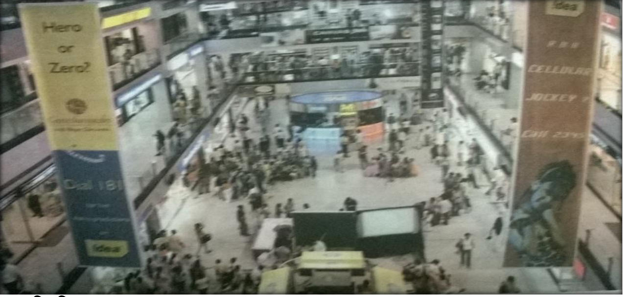
विपणिः समानता च

अस्मिन् अध्याये अस्माभिः स्वस्य प्रतिवेशस्य कासाञ्चित् विपणीनां विषये परिशीलनं कृतम् अस्ति । अस्माभिः साप्ताहिकविपणेः आरभ्य शापिंग-काम्प्लेक्स इत्येतत् यावत् सर्वे आपणिकाः आपणाः च दृष्टाः । एतयोः द्वयोः आपणिकयोः मध्ये महत् अन्तरम् अस्ति । कश्चित् लघुराश्या स्वव्यापारं चालयति तादृशः आपणिकः अस्ति, अपरस्मिन् पक्षे अपरः आपणिकः स्वस्य आपणस्य कृते महाराशिं व्ययीकर्तुं शक्नोति । एतयोः आयः अपि पृथक् पृथक् भवति । साप्ताहिकविपणेः लघु-आपणिकः विक्रयणस्थानस्य व्यापरिणः तुलनायाम् अत्यल्पं लाभांशम् अर्जयति । अनेन एव प्रकारेण क्रेतृणाम् अपि पृथक् पृथक् श्रेण्यः स्थितयः च सन्ति । एतादृशाः बहवः जनाः सन्ति ये अल्प-मूल्ययुक्तानि वस्तूनि अपि क्रेतुं समर्थाः न सन्ति, अपरस्मिन् पक्षे जनाः विक्रयण-स्थानकेषु महार्घं विक्रयणं कर्तुं व्यस्ताः दृश्यन्ते । अनेन प्रकारेण अन्यानि कारणानि अतिरिच्य अस्माकम् आर्थिक-स्थितिः एव निर्धारणं करोति यत् वयं कीदृशीसु विपणिषु आपणिकाः अथवा क्रेतारः भवितुं शक्नुमः।